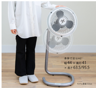
本体寸法 (cm): 幅 44 × 奥行 41 × 高さ 63.5/95.5