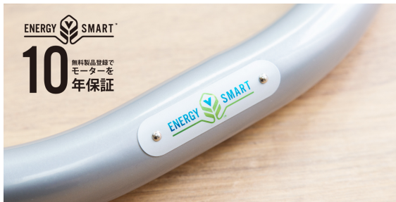
エナジースマート