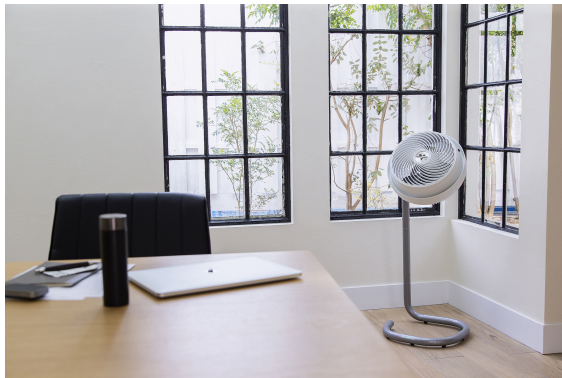
書類を飛ばさない