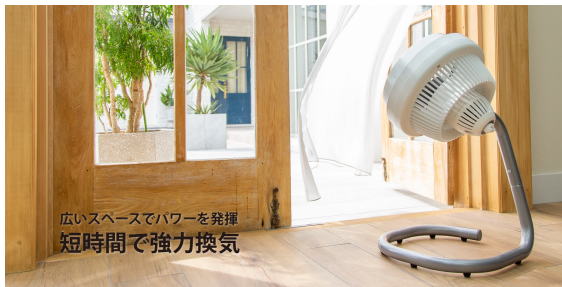
広いスペースでパワーを発揮 短時間で強力換気