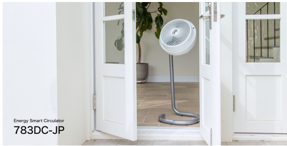
Energy Smart Circulator 783DC-JP